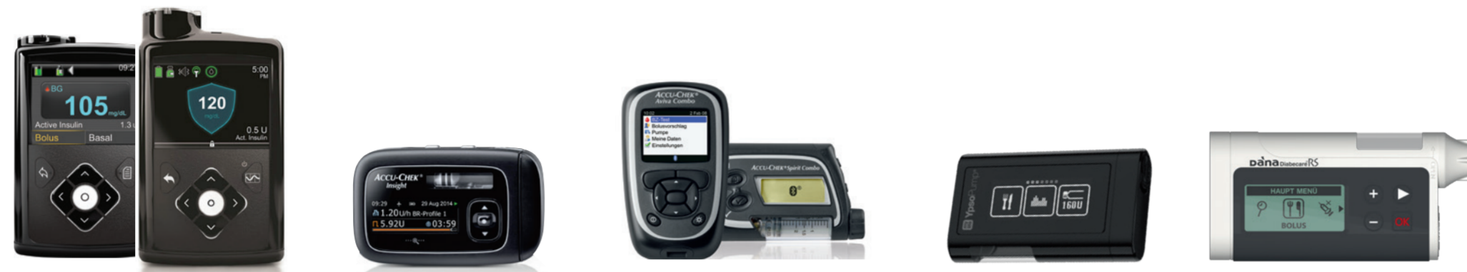
MiniMed 640G / 670G Accu-Chek Insight Accu-Chek Combo mylife YpsoPump Dana Diabecare R/RS